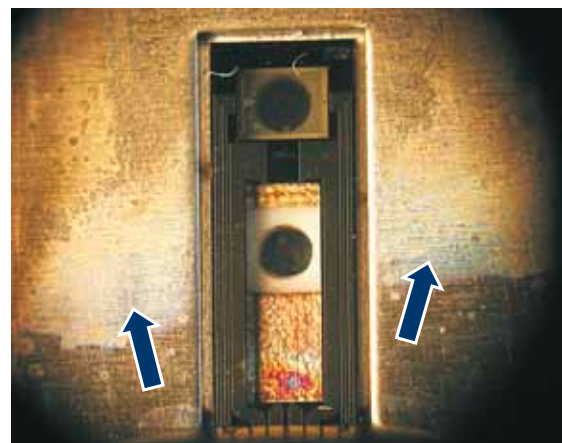
Последствия очистки сжатым воздухом

Слева: пленка, на которой нанесены чувствительные элементы, прямо-таки «расстрелена» частицами.