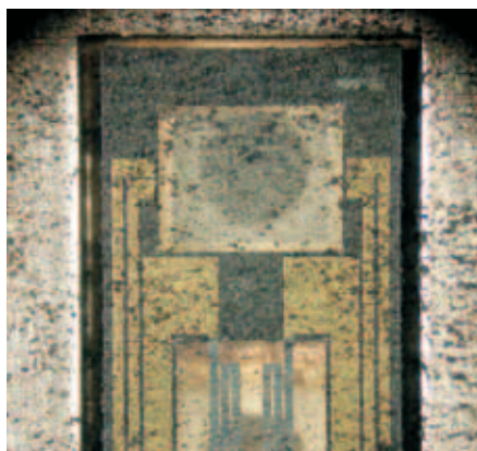
Соль и грязь могут повредить датчик сенсора воздушных масс – по меньшей мере, однако, они фальсифицируют их измерения, что снова может повлиять на рециркуляцию отработавших газов.