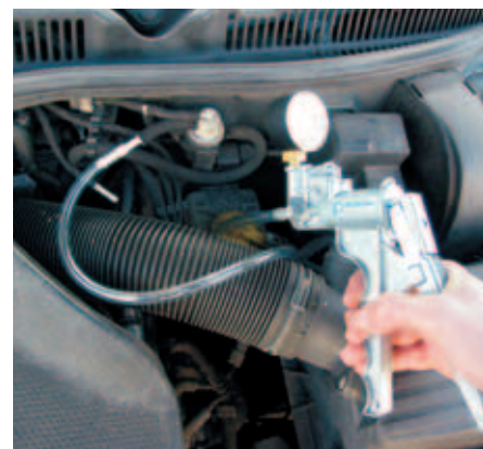
Пневматические клапаны системы рециркуляции ОГ или как здесь, электропневматические преобразователи: с помощью ручного вакуумного насоса можно легко проверить их функции.