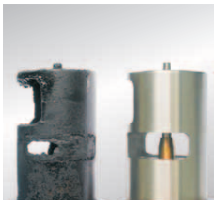
Так как клапаны системы рециркуляции ОГ не могут самостоятельно покрыться копотью, то необходимо выяснить причину ее возникновения.

Дефектный элемент конструкции всегда нужно заменять новым.