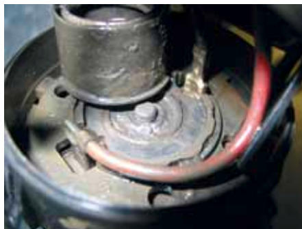
Агрессивный конденсат отработавших газов в приводном двигателе насоса вторичного воздуха

Если впуск вторичного воздуха происходит не из всасывающего тракта, а непосредственно из подкапотного пространства, то перед насосом вторичного воздуха находится отдельный фильтр для очистки воздуха, который может быть засорен.