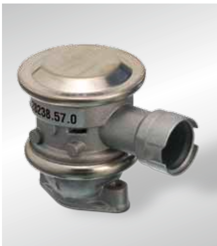
Отключаемый обратный клапан, управляемый давлением (прибл. с 1998 года)