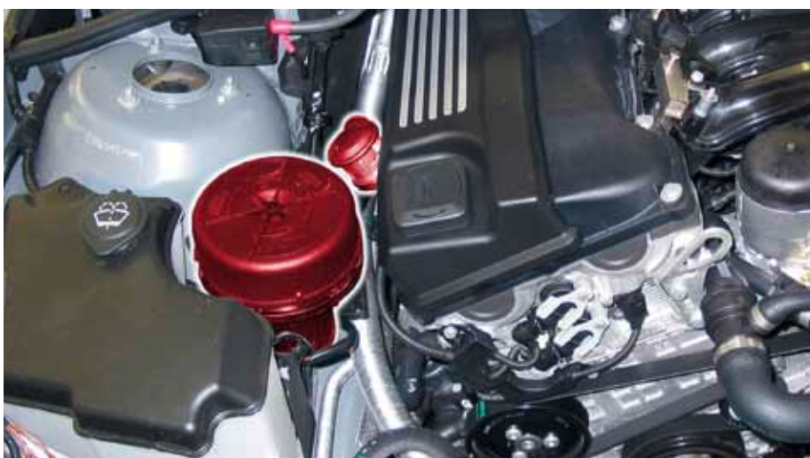
Клапан вторичного воздуха и насос вторичного воздуха в BMW E46 (выделено)

Сохраняем за собой право на внесение изменений и на отклонения в иллюстрациях.