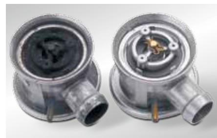
Открытый клапан вторичного воздуха слева: повреждения из-за конденсата отработавших газов справа: в новом состоянии