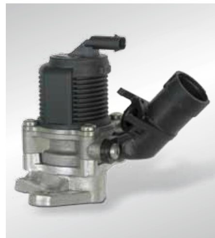
Электрический клапан вторичного воздуха (прибл. с 2007 года)