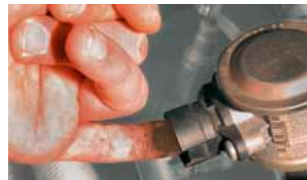
«Проверка на ощупь» на клапане вторичного воздуха в BMW 520i (выделено) Если на этой стороне есть отложения, то обратный клапан негерметичен и должен быть заменен.