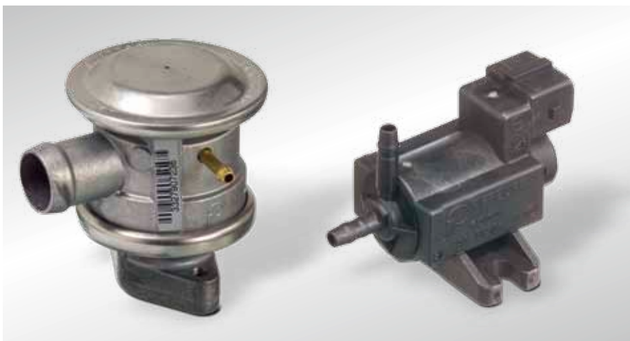
Управляемый вакуумом отключающий обратный клапан (прибл. с 1995 года) и электрический переключающий клапан