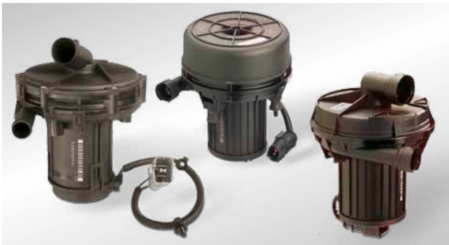
Различные насосы вторичного воздуха 1-го и 2-го поколения

Для контроля с помощью системы бортовой диагностики (OBD) электрические клапаны вторичного воздуха могут быть оснащены интегрированным датчиком давления.