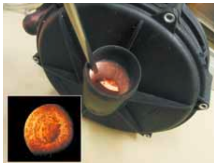
Взгляд на вход насоса вторичного воздуха