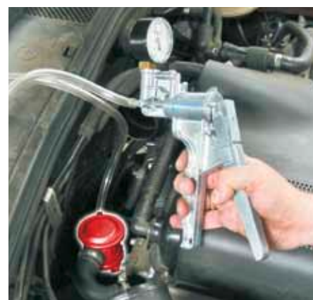
Проверка клапана вторичного воздуха с помощью ручного вакуумного насоса