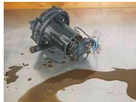
Жидкий конденсат отработавших газов из насоса вторичного воздуха