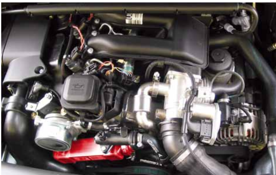
рис. 2: радиатор системы рециркуляции отработавших газов в BMW 318d (выделено красным цветом)

Их название сокращается на \text{NO}_x , так как по причине наличия большого количества степеней окисления кислорода появляются много соединений азота и кислорода. Оксиды азота раздражают и вредят дыхательным органам, они разделяют ответственность за образование смога и озона и поддерживают образование кислого дождя.