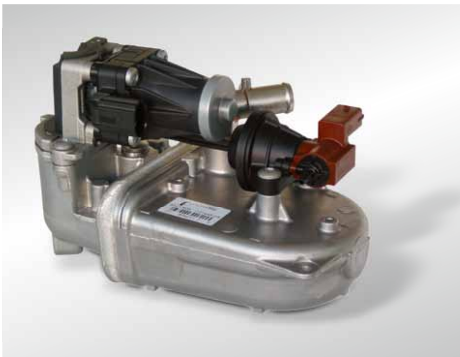
рис. 3: модуль для радиаторов системы рециркуляции ОГ марки PIERBURG с интегрированным клапаном системы рециркуляции ОГ и перепускная заслонка, устанавливаемые на Fiat и GM