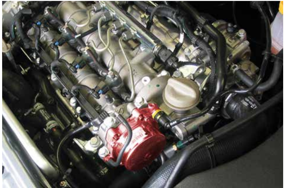
Вакуумный насос в Opel Vectra B (подчеркнуто)

Так как из-за выхода усилителя тормозного привода из строя может возникнуть опасная ситуация, вакуумный насос применяют в качестве предохранительного устройства.