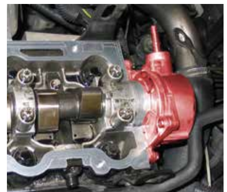
Вакуумный насос и распределительный вал в Opel Vectra B (подчеркнуто)