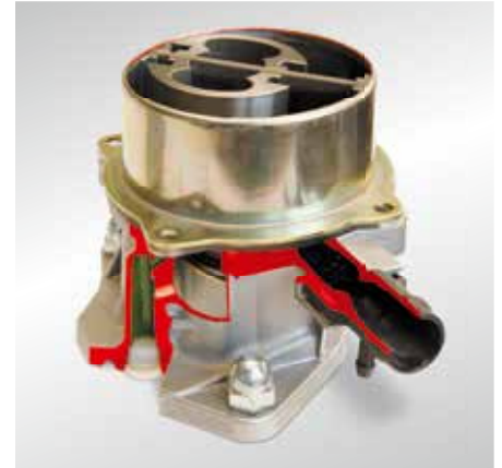
Самая современная модель: Одностворчатый вакуумный насос (модель в разрезе)