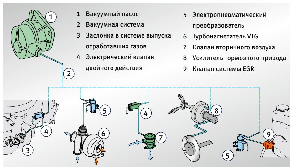
Вакуумные насосы: Области применения (выборочно)

Сохраняем за собой право на внесение изменений и на отклонения в иллюстрациях.