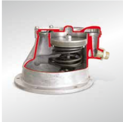
Классический поршневой вакуумный насос (модель в разрезе)

Новая тенденция заключается в сочетании насосов подачи для различных сред (двойные насосы): Комбинированные топливные/вакуумные насосы устанавливаются на одной оси с распределительным валом. Комбинированные вакуумные/масляные насосы монтируются в масляном поддоне.