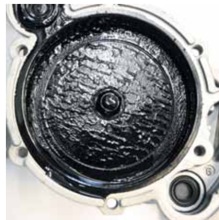
Рис. 3: масляный шлам в вакуумном насосе грузопассажирского автомобиля VW приводит к появлению стука

Подобная рекламация поступает также в случае установки неподходящего вакуумного насоса со слишком коротким толкателем (3).