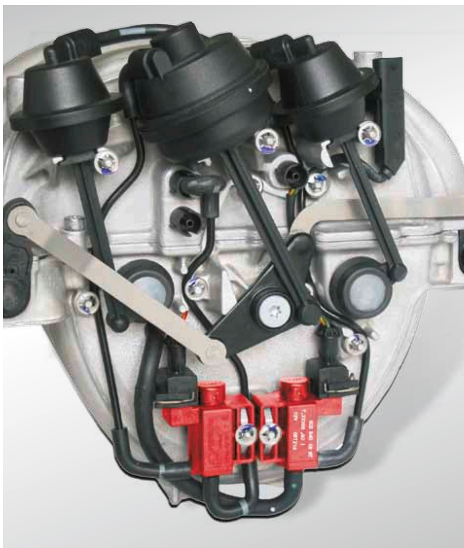
Пример применения: всасывающий трубопровод с электропневматическими клапанами (выделено красным цветом) в автомобилях Mercedes класса C

Эти клапаны существуют в различных исполнениях и имеют различные обозначения (смотри информацию на стр. 4). Наиболее распространенные клапаны указаны на последующих страницах.