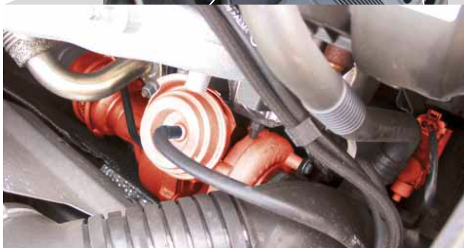
Клапан EPW и VTG-турбоагнетатель (выделено красным) в автомобиле A4 TDI