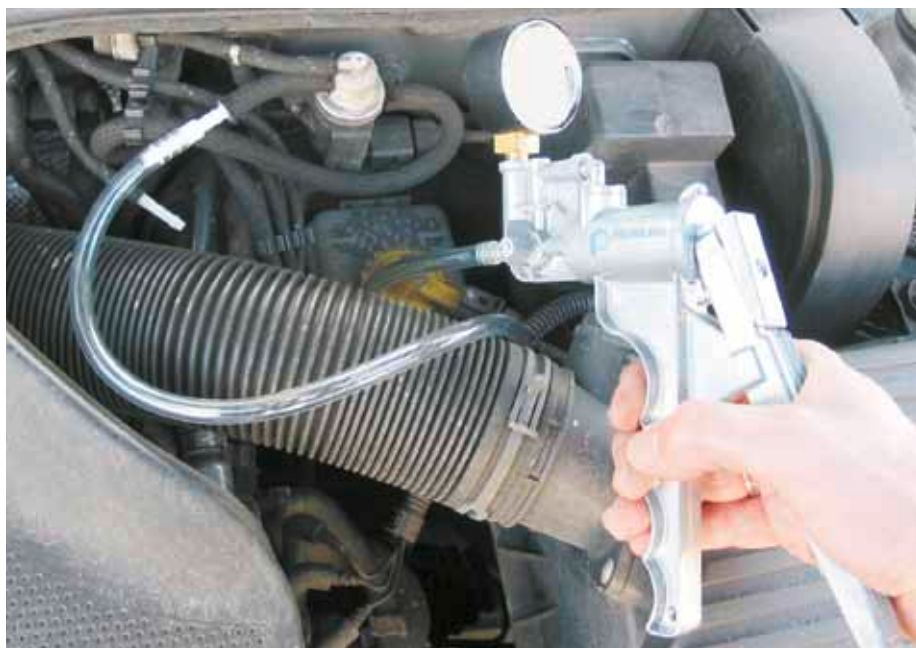
Проверка клапана EPW с использованием ручного вакуумного насоса (автомобиль VW Golf IV)

Поэтому во всех случаях необходимо пользоваться услугами специалиста, который обладает необходимыми знаниями системы и который не только слепо полагается на сигнал о нарушении в работе и просто