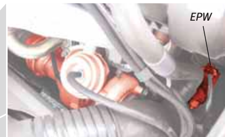
Пример: турбонагнетатель с переменной геометрией турбины и EPW (выделены красным цветом) в Audi A4 TDI

Сохраняем за собой право на внесение изменений и на отклонения в иллюстрациях.