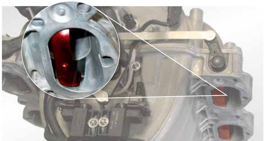
Перекидные заслонки (выделены красным цветом) во впускной трубе PIERBURG, например, в Mercedes E-класса 500