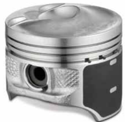
Поршни фирмы KS со специальным днищем для режима послыного заряда

Не полностью открытая дроссельная заслонка ограничивает во всасывающем тракте подачу свежего воздуха. Возникающее при этом сопротивление приводит к возникновению «потерь при дросселировании». Любая мера, позволяющая открыть дроссельную заслонку пошире («устранить дросселирование»), способствует снижению потерь при дросселировании и расхода топлива.