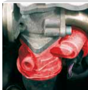
Регулирующая заслонка вблизи (выделена красным цветом)

Разности давления между стороной выпуска и стороной всасывания не достаточно для высоких скоростей рециркуляции ОГ, которые требуются в дизельных автомобилях. Для повышения разрежения для точного регулирования скорости рециркуляции ОГ во впускном коллекторе устанавливается «регулирующая заслонка». При выключении двигателя регулирующая заслонка заблаговременно закрывается и исключает, таким образом, «дизелинг».