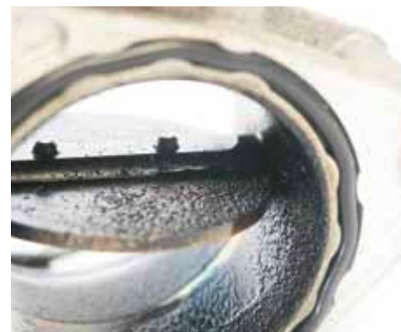
Регулирующая заслонка в замасленном состоянии

Мы не рекомендуем выполнять чистку регулирующей заслонки: