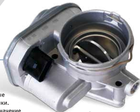
Вид регулирующей заслонки

1 На практике применяются различные обозначения регулирующих заслонок, например, дроссельные заслонки, дизельные заслонки, дизельные предзаслонки. У VOLKSWAGEN используется обозначение «Заслонка впускного коллектора».