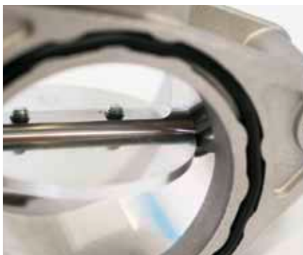
Новая регулирующая заслонка